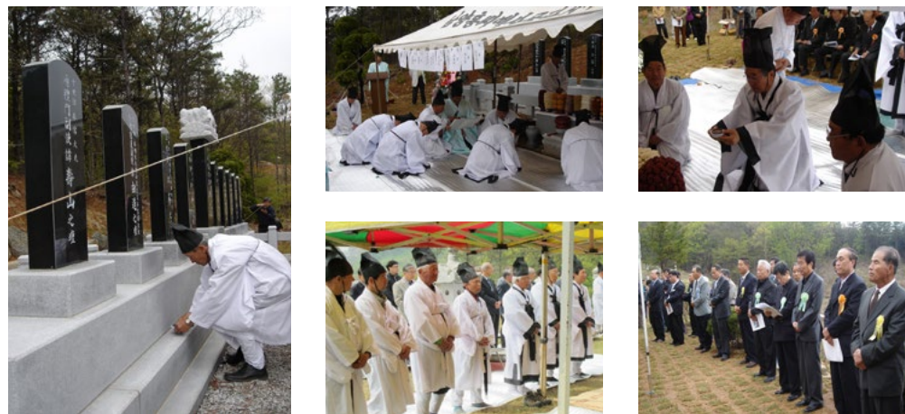
김포 춘향대제 봉행 (매년 양력 4월 마지막 토요일)