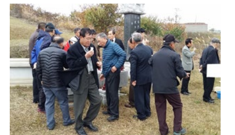
서신 시제 봉행 (매년 음력 10월 5일)