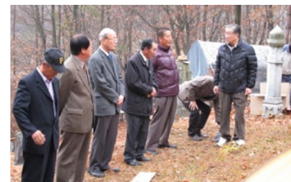
양지 시제 봉행 (매년 음력 10월 3일)